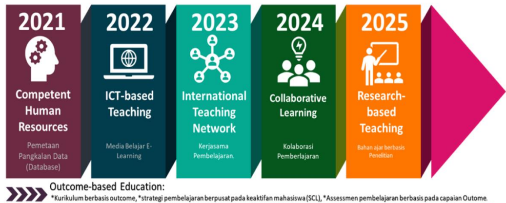
Gambar 2. Roadmap Capaian Lima Tahun Pertama (2021-2025)

Tema yang diusung pada setiap tahapan dalam penyusunan indikator kinerja diintegrasikan dengan tuntutan indikator kinerja pada bidang ataupun kriteria lainnya, sehingga setiap rencana kinerja dan indikator kinerja dapat memenuhi tuntutan di beberapa kriteria pada instrumen akreditasi APS dan APT. Indikator kinerja tahun pertama (2021) terfokus pada Competent of Human Resources .