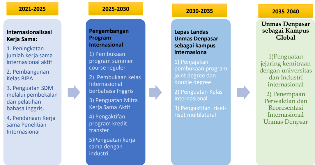
Gambar 3. Milestones Renstra Unmas Denpasar

upaya-upaya terdiri dari milestone kerja sama Unmas Denpasar yang diturunkan dari Renstra Unmas Denpasar.