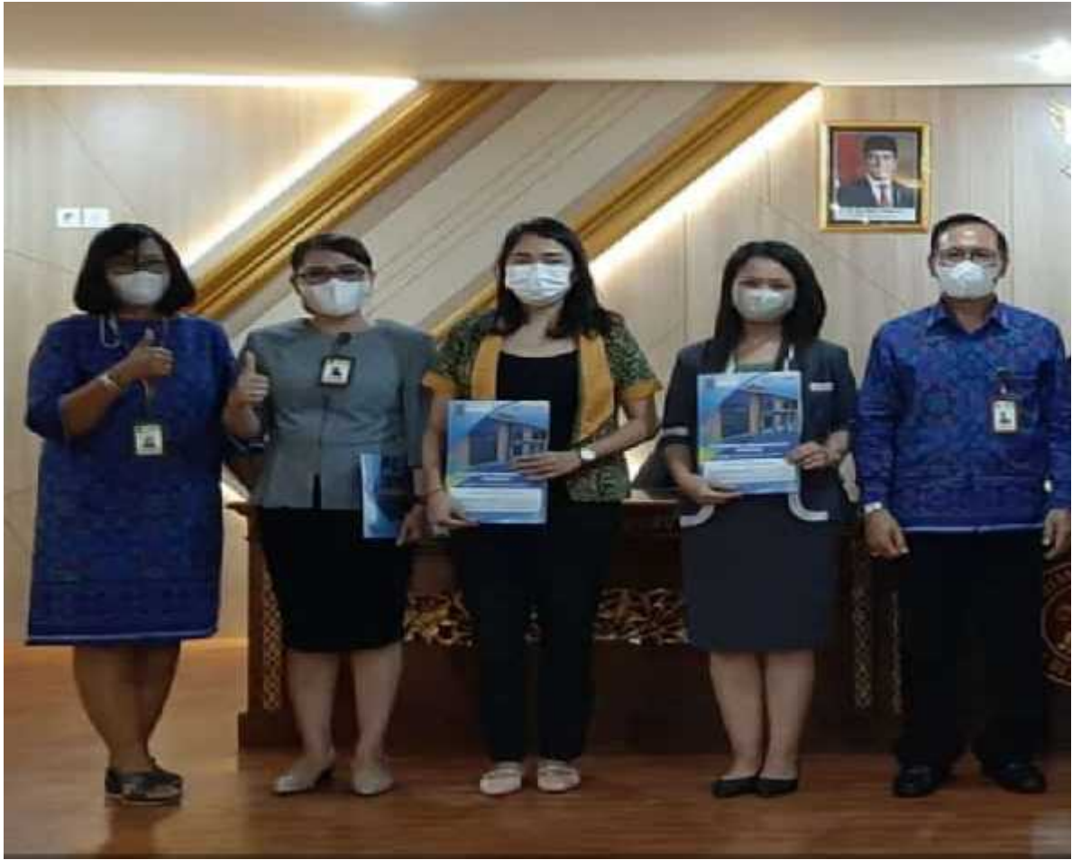
Acara Penyerahan Kejuaraan UMDAQA XIII