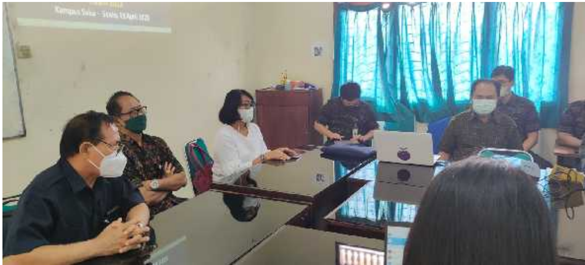
Photo Tim Juri pada saat visitasi UMDAQA XIII