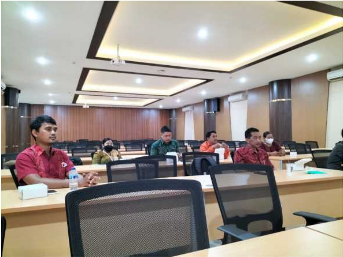
Rapat Tim Juri dalam rangka penentuan juara UMDAQA XIII